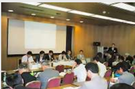
設立記念フォーラム

STATION(駅)っていろんな人がいろんな声があちこちから集まって来ますよね。私たちもそんな集合体でありたいと願っています。