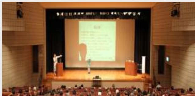
液状化対策セミナー