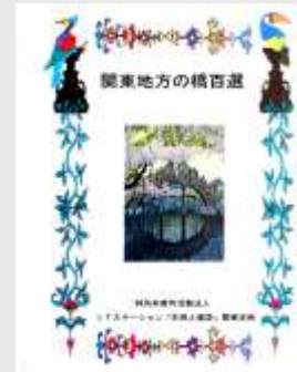
橋 100 選 冊子 ▶

土木事業のイメージアップを図るため日本各地で住民に親しまれている橋を選定して逐次発表している。今までの成果は小冊子として発行されている。