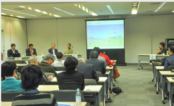
水辺劇場都市にいがたフォーラム Part 2の様子

本フォーラムは、当会と新潟工科大学による共同事業であり、平成 20 年度の「まちの体温測定プロジェクト」をベースとして、これまであまり注目されなかった日本海や信濃川等が起因すると思われる温熱環境に着目し、各種調査・分析結果や専門家・市民の意見などを加えながら50年後の暮らしやすい新潟の将来像を描くべく、取り組んでいるものです。