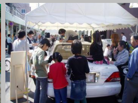
ファーマーズマーケット社会実験の様子