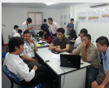
ジャカルタ MRT 研修 (リ-クジョ-フ) 若手研修活動