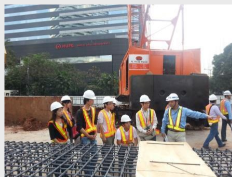
ジャカルタ MRT 視察若手研修活動