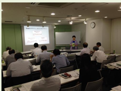
世古理事による講義風景