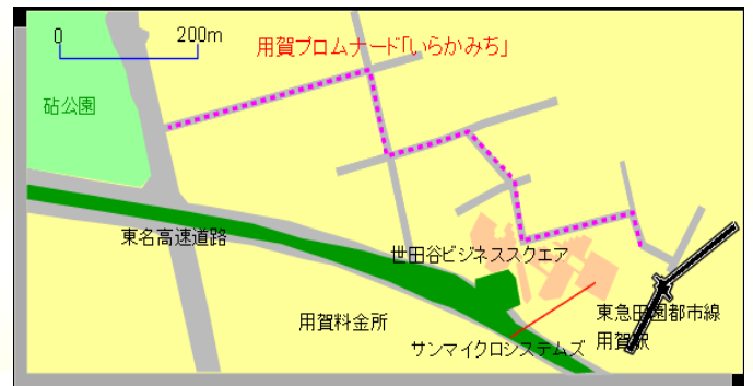
用賀プロムナード「いらかみち」のルート

を敷き詰め、日本のいにしえに心を遊ばせる道となっている。また、歩道のデザインには流れを取り入れ、エリアごとにと、みちのホール、みちのギャラリー、みちのサロン、並木みち、いらかブロックといったコンセプトを反映させている。