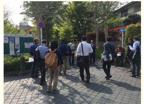
用賀プロムナード・フィールドワーク

を敷き詰め、日本のいにしえに心を遊ばせる道となっている。また、歩道のデザインには流れを取り入れ、エリアごとにと、みちのホール、みちのギャラリー、みちのサロン、並木みち、いらかブロックといったコンセプトを反映させている。