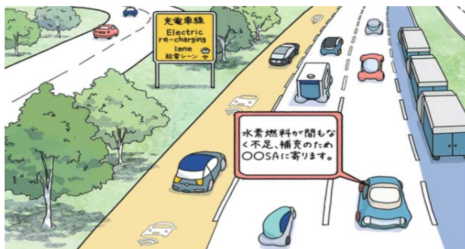
●電気自動車や燃料電池車のための非接触給電レーンや水素ステーション