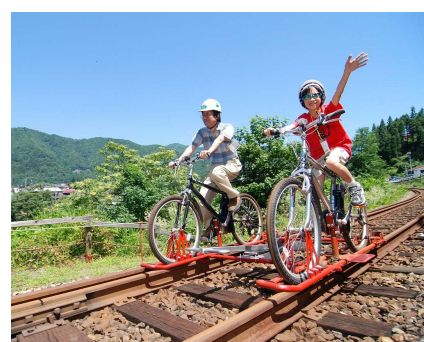
● カップル・親子・3世代ファミリーも楽しめます