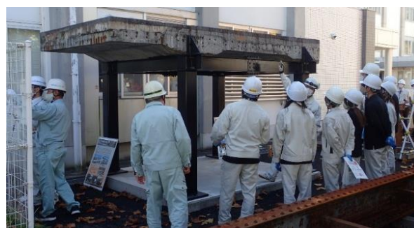
高専・大学生向け現場学習会