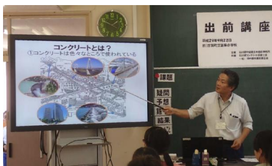
小学生を対象とした出前講座