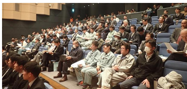
フォーラムの開催