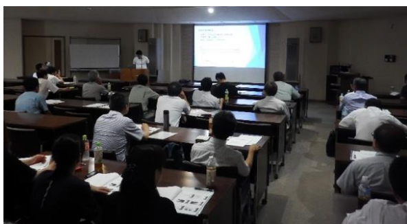
技術交流会（事例発表会）