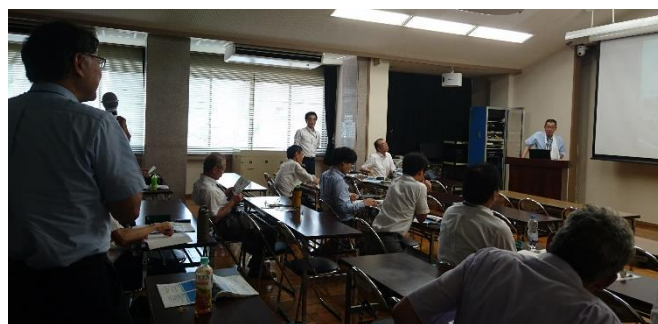
研究部会（構造部会）活動