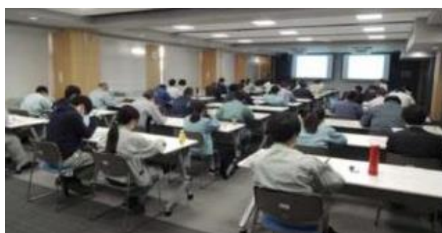
研修会への講師派遣