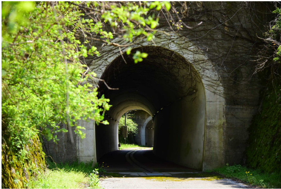
●手前は天井川下のトンネル・奥は国道下のトンネル