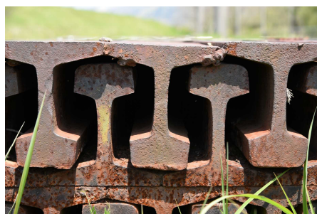
●脇に置かれた当時のレール