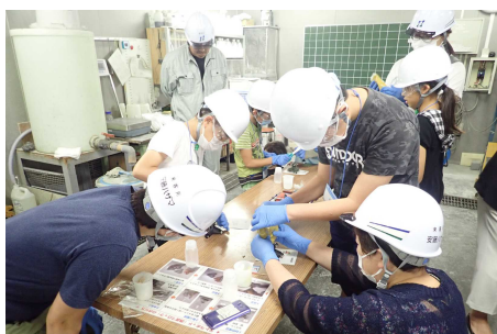
●科学技術振興プログラム （つくばちびっ子博士）