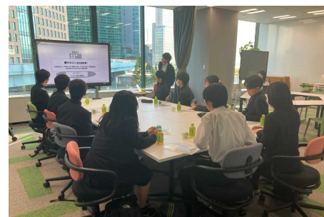
●高校生による企業訪問