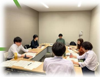
ディレクター会議